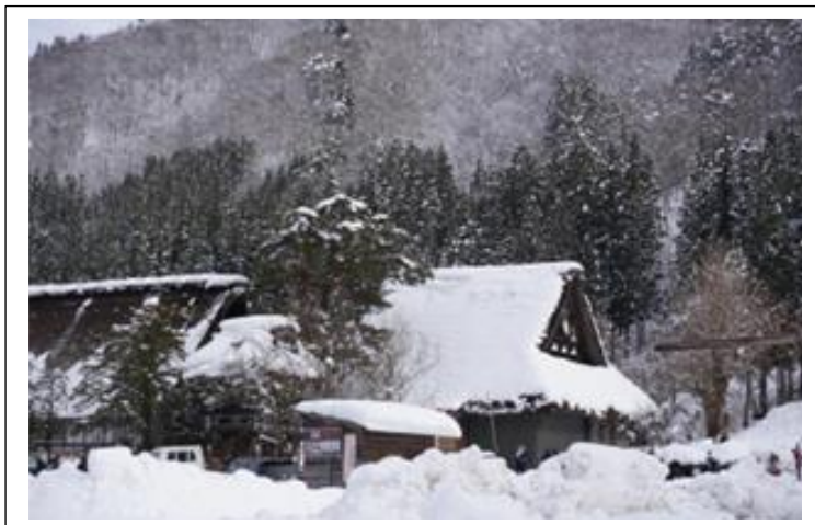
Winter in Shirakawa

Alltag: Unbedingt japanische Freundschaften suchen. Sie ermöglichen nicht nur sprachliche Fortschritte, sondern auch einen Zugang zu kulturellen Erlebnissen, die internationalen Studierenden sonst verschlossen bleiben.