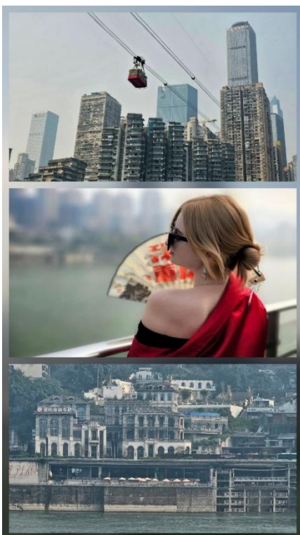
Abbildung 3 Chongqing – berühmt für seine mehrschichtige Stadtstruktur und die charakteristische Cyberpunk-Ästhetik.