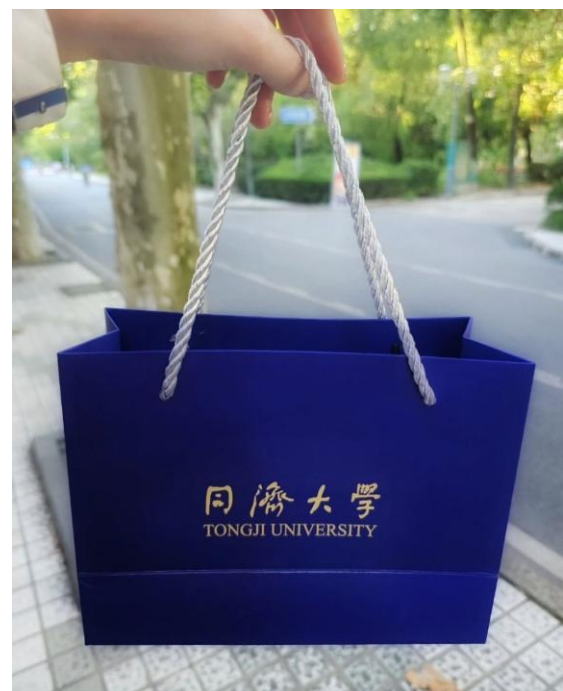
Abbildung 1 Mondfest an der Tongji University – Mondkuchen 月餅 als Willkommensgeschenk für internationale Studierende.

Dennoch bestehen in einzelnen digitalen und administrativen Systemen weiterhin strukturelle Barrieren für ausländische Personen, insbesondere dort, wo nationale Identifikationssysteme oder staatliche Subventionsprogramme eine Rolle spielen. Gleichzeitig ist eine klare Dynamik in Richtung Modernisierung und Internationalisierung erkennbar.