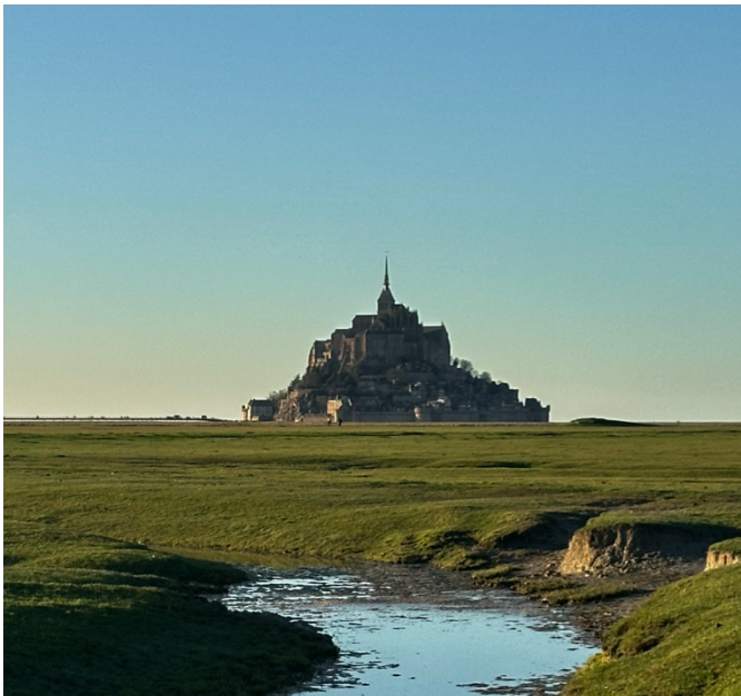
Abbildung 3: Der Mont St-Michel ist in Wirklichkeit noch viel schöner als auf Bildern.