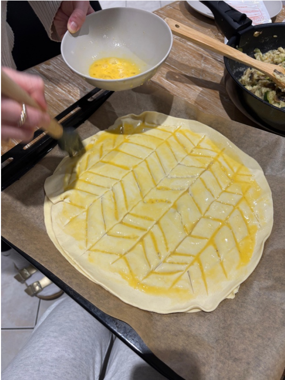
Abbildung 1: Zu Beginn des Jahres darf die Tradition der Galette des Rois nicht fehlen!