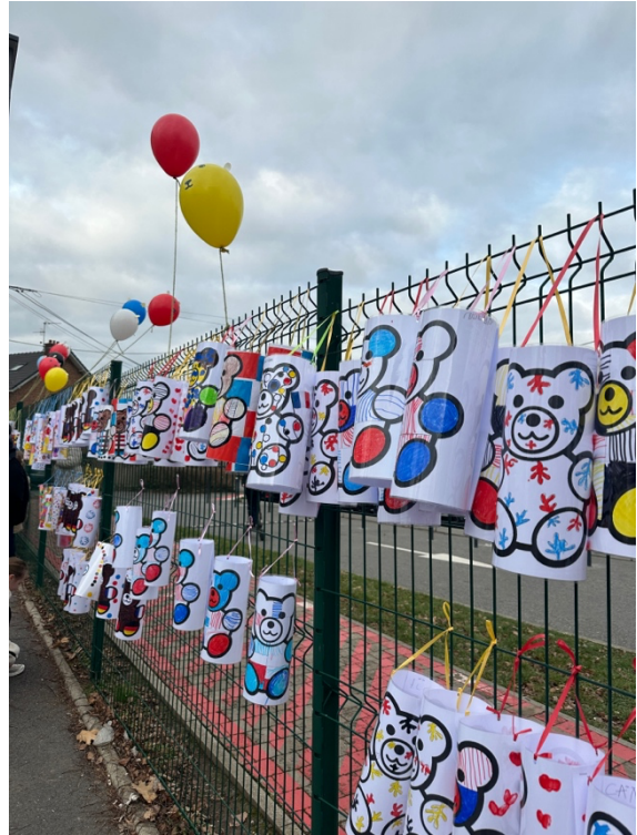
Abbildung 2: Die Bodybären, die die Schüler:innen zur Feier des deutsch-französischen Freundschaftstags erstellt haben