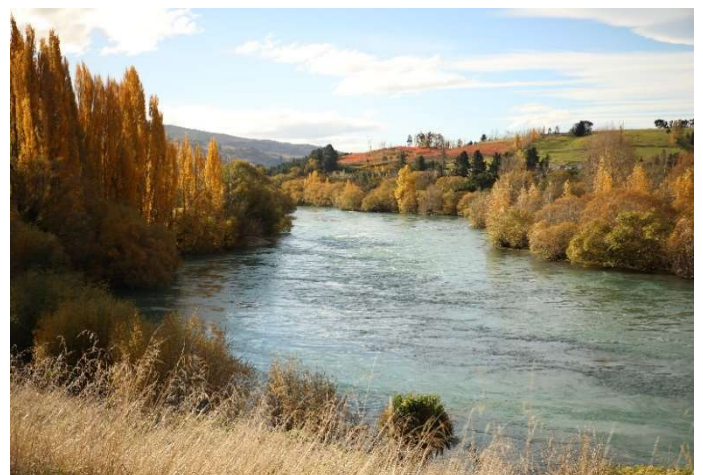
Clutha River, Central Otago, auf dem Weg von Dunedin nach Wanaka

Mein Aufenthalt hat durch meinen neu gewonnenen Freund eine besondere interkulturelle Note bekommen. Obwohl ich viele Freunde unterschiedlicher kultureller, religiöser oder nationaler Herkunft habe, habe ich diesmal zum ersten Mal erfahren, was für einen großen Einfluss Kulturunterschiede und Sprachbarrieren haben können. Bei den eigenen Handlungen ist man sich oft nicht bewusst, dass sie von anderen ganz unterschiedlich wahrgenommen werden können. So lernt man über Missverständnisse und Gespräche viel über andere Kulturen und Normen, aber auch genau so viel über seine eigene Kultur, denn man wird auf Aspekte aufmerksam gemacht, die man zuvor nie hinterfragt hätte. Auch wenn diese Kulturunterschiede in einer engen Freundschaft manchmal anstrengend sein können, haben sie einen unglaublichen Mehrwert, da sie uns sensibler gegenüber anderen Kulturen machen und wir unseren Horizont auf wunderbare Weise erweitern.